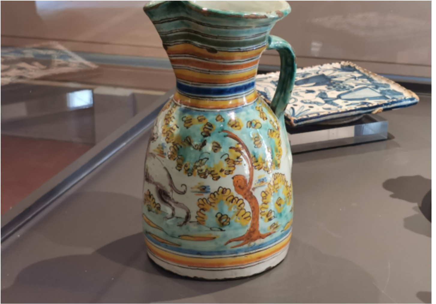
Pieza en exposición. (Eulàlia Rodríguez Pitarque)