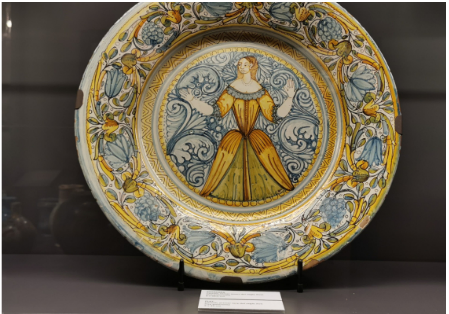
Otra pieza de la exposición 'A la recerca de la bellesa'. (Eulàlia Rodríguez Pitarque)

Es un buen momento para volver a visitar la Fundación Mascort y recorrer sus diferentes estancias, así como contemplar una vez más la belleza del ovalado patio azul interior.