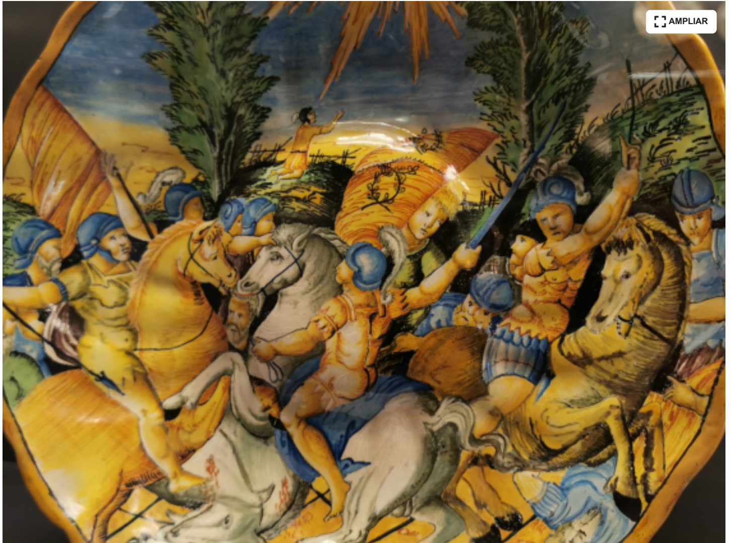
Detalle de una pieza de la exposición 'A la recerca de la bellesa'. (Eulàlia Rodríguez Pitarque)

La colección contiene obras de procedencias tan diversas como la catalana, italiana, francesa, holandesa, suiza, persa, china y precolombina.