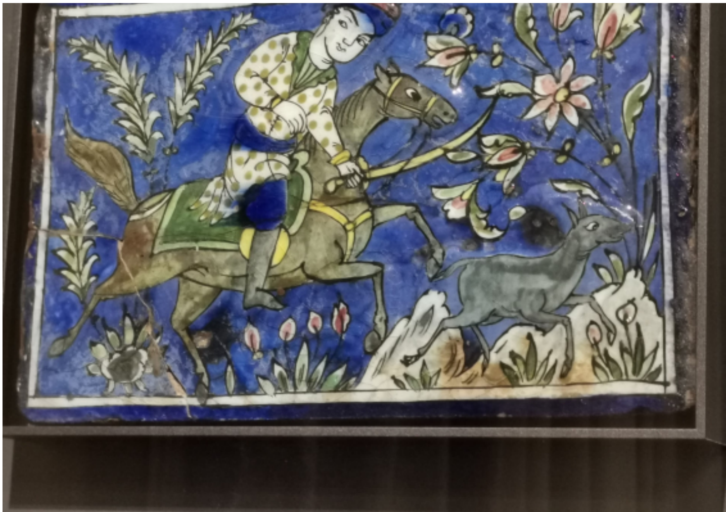
Detalle de una pieza de la exposición 'A la recerca de la bellesa'. (Eulàlia Rodríguez Pitarque)