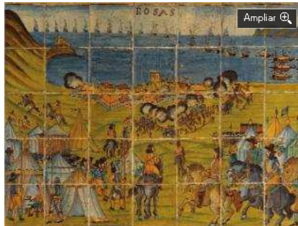
Mostren 700 rajoles i socarrats ceràmics des del segle XIII fins a principis del XX